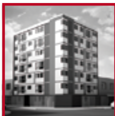
Edificio Camino del Parque PUEBLO LIBRE ABRIL 2016