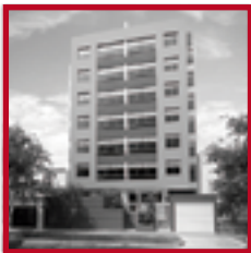
Residencial Los Nogales MAGDALENA DEL MAR DICIEMBRE 2017