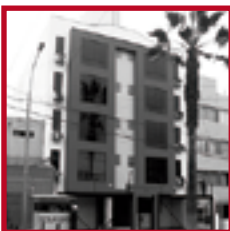
Edificio Parque Grau PUEBLO LIBRE JULIO 2007