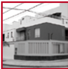
Residencial Los Nopales SAN ISIDRO ENERO 2010