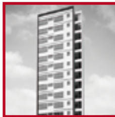
Casa Club Ipanema PUEBLO LIBRE AGOSTO 2017