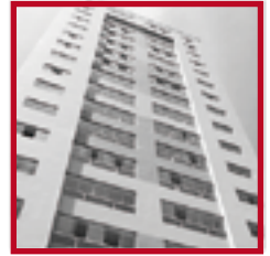
Edificio El Libertador PUEBLO LIBRE FEBRERO 2012