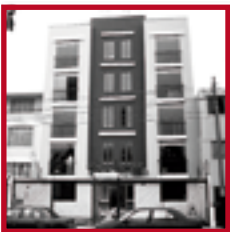
Edificio Río Grande PUEBLO LIBRE MAYO 2010