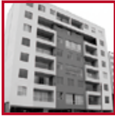
Edificio Los Tulipanes MAGDALENA DEL MAR OCTUBRE 2012