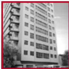
Casa Club Marina PUEBLO LIBRE OCTUBRE 2017