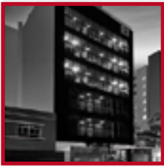
Edificio Corporativo Quarzo MIRAFLORES NOVIEMBRE 2013