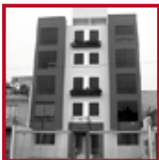
Residencial Antioquia PUEBLO LIBRE JULIO 2007