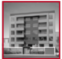
Edificio Sucre 595 SAN MIGUEL MARZO 2017