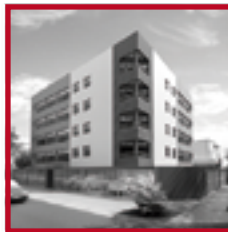
Residencial Los Álamos SAN MIGUEL SETIEMBRE 2017