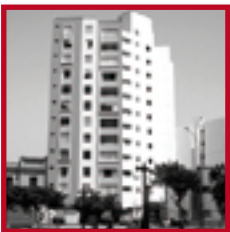
Edificio Los Libertadores MAGDALENA DEL MAR DICIEMBRE 2008