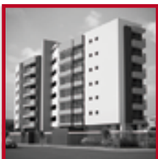
Residencial Murano MAGDALENA DEL MAR ENERO 2017