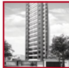
Edificio Parque San Martín II PUEBLO LIBRE SETIEMBRE 2018