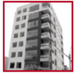
Edificio Del Parque PUEBLO LIBRE DICIEMBRE 2012