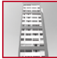
Edificio Alcalá PUEBLO LIBRE FEBRERO 2013