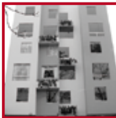
Edificio Barcelona I PUEBLO LIBRE SETIEMBRE 2008