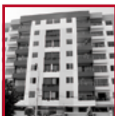
Residencial Parque Borgoño PUEBLO LIBRE MARZO 2015