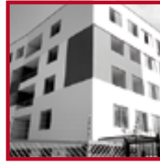
Residencial Santa Mariana CERCADO DE LIMA FEBRERO 2012