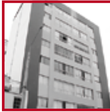
Edificio Los Gladiolos PUEBLO LIBRE ABRIL 2012