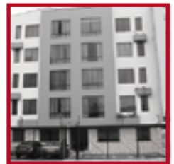
Residencial San Andrés PUEBLO LIBRE NOVIEMBRE 2007