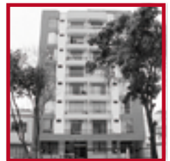
Edificio Los Andes PUEBLO LIBRE FEBRERO 2009