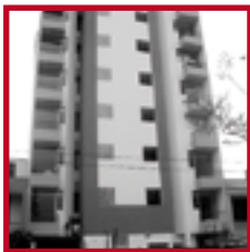
Edificio Colmenares PUEBLO LIBRE OCTUBRE 2008