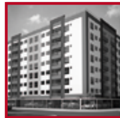
Residencial Alameda SAN MIGUEL MAYO 2017