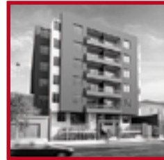
Residencial El Prado SAN MIGUEL AGOSTO 2019