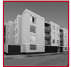
Residencial Tradiciones PUEBLO LIBRE SETIEMBRE 2010