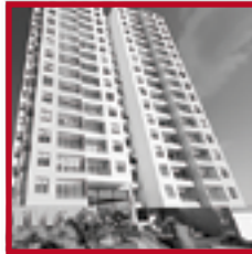
Ávida SAN MIGUEL MAYO 2020