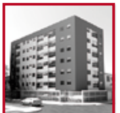
Edificio Barcelona II PUEBLO LIBRE SETIEMBRE 2015