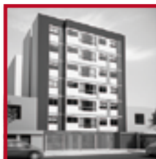
Edificio Punta Del Este PUEBLO LIBRE ABRIL 2016