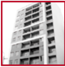
Casa Club La Floresta MAGDALENA DEL MAR TORRE A | TORRE B | TORRE C NOV. 2013 | OCT. 2014 | NOV. 2015