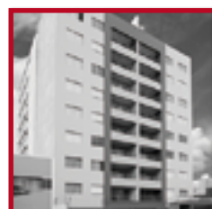
Residencial Las Acacias MAGDALENA DEL MAR FEBRERO 2014