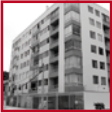
Edificio Triana PUEBLO LIBRE DICIEMBRE 2012