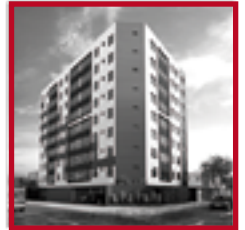
Residencial Los Eucaliptos MAGDALENA DEL MAR JULIO 2019