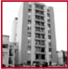
Edificio Parque San Martín I PUEBLO LIBRE MARZO 2010