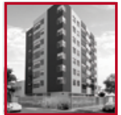
Edificio Rivadavia II PUEBLO LIBRE ENERO 2018