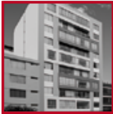
Edificio Clement PUEBLO LIBRE AGOSTO 2011