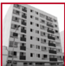
Residencial Amatista PUEBLO LIBRE ABRIL 2015