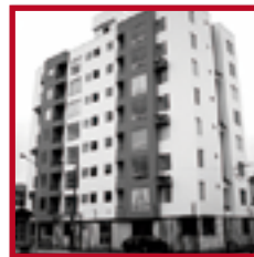
Edificio La Ribera PUEBLO LIBRE MAYO 2008