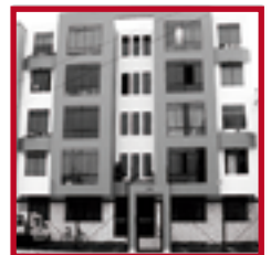
Edificio Parque Ayacucho PUEBLO LIBRE AGOSTO 2006