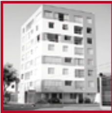
Edificio Del Río PUEBLO LIBRE DICIEMBRE 2011