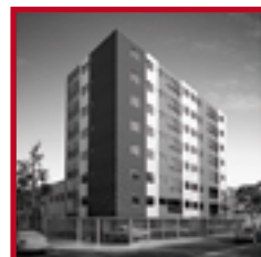
Edificio Rivadavia I PUEBLO LIBRE NOVIEMBRE 2015