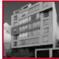
Residencial Torre Tagle PUEBLO LIBRE FEBRERO 2011