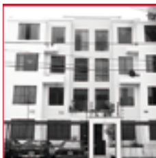
Residencial Esmeralda BREÑA FEBRERO 2007