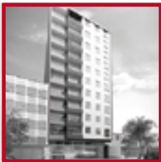
Residencial Belice MAGDALENA DEL MAR FEBRERO 2019