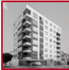
Residencial Sevilla PUEBLO LIBRE MAYO 2011