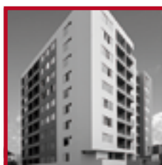
Edificio Bali PUEBLO LIBRE MAYO 2014