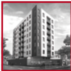
Residencial Paseo del Parque SAN MIGUEL JULIO 2018