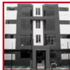
Residencial Los Lirios PUEBLO LIBRE NOVIEMBRE 2006