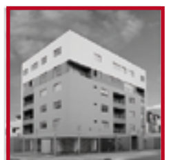
Residencial Parque El Gondal PUEBLO LIBRE DICIEMBRE 2013