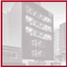
Edificaciones Inmobiliarias MUY PRONTO

NUESTROS MÁS DE 48 EDIFICIOS ENTREGADOS A TIEMPO SON SUEÑOS CUMPLIDOS DE MÁS DE 1500 FAMILIAS