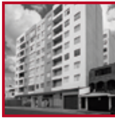
Residencial Asturias PUEBLO LIBRE OCTUBRE 2013