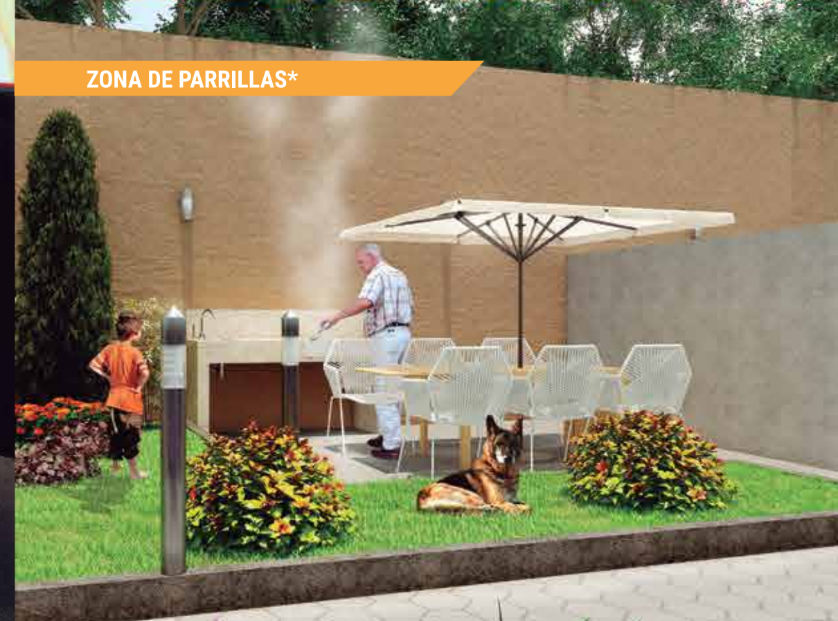
ZONA DE PARRILLAS*